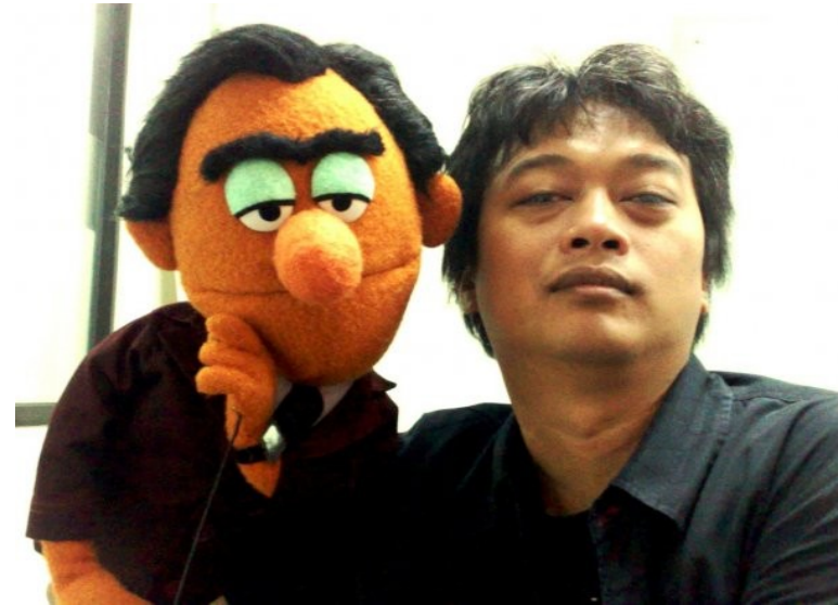
AM aus Jakarta Religion: Islam Beruf: Producer live action film, Sesame Street Indonesia

„Schade, daß die internationale Medien meistens nur über die religiösen Konflikte statt über den Alltag in unserem guten Zusammenleben berichten. Es stimmt, es gibt Gruppen, die sehr gerne Unruhe stiften, sowie die Gruppen, die Indonesien in einen moslemischen Staat umwandeln möchten. Diese Leute sind aber nicht viele. Meistens fragen sich die Leute: ist das Ziel solcher Gruppen wirklich für die Religion, oder benutzen sie nur die Religion für ihre Ziele? Zum Glück ist bei Akademiker der Religionsunterschied kein Problem. Wir leben miteinander noch in Harmonie.“