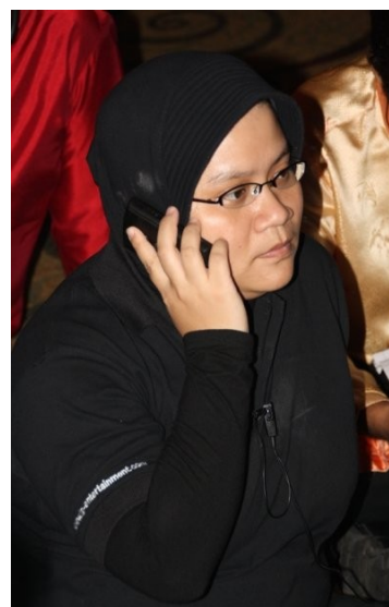
IS aus Jakarta Religion: Islam Beruf: Trainer & Event Organizer

„Die größte Moschee in Bandung bekam auch Spende aus christliche Organisationen. In Jakarta, sind die Kathedrale und größte Moschee Istiqlal beide Nachbarn und begrüßen einander an religiösen Feiertagen durch riesige Schilder. In meinem Büro ist der religiöse Unterschied sehr nützlich, besonders beim Sicherheitspersonal. In Idulfitri wachen die Christen und in Weihnachten wachen die Moslems. Indonesien ist eigentlich ein gutes Beispiel für das Zusammenleben zwischen Religionen. Der Bombenteror und die Unruhe in Ambon und Poso passierten wegen einer kleinen Gruppe die das gute Zusammenleben provozieren möchte. Doch in Prozenten ausgedrückt sind diese Leute sehr wenig.“