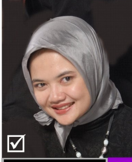
Partai Bulan Maret 69