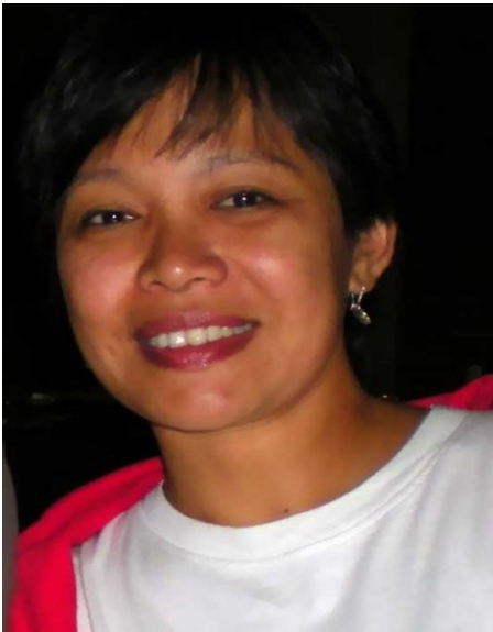
AMA aus Bandung Religion: Islam Beruf: Textildesignerin

„Schade, daß die internationale Medien meistens nur über die religiösen Konflikte statt über den Alltag in unserem guten Zusammenleben berichten. Es stimmt, es gibt Gruppen, die sehr gerne Unruhe stiften, sowie die Gruppen, die Indonesien in einen moslemischen Staat umwandeln möchten. Diese Leute sind aber nicht viele. Meistens fragen sich die Leute: ist das Ziel solcher Gruppen wirklich für die Religion, oder benutzen sie nur die Religion für ihre Ziele? Zum Glück ist bei Akademiker der Religionsunterschied kein Problem. Wir leben miteinander noch in Harmonie.“