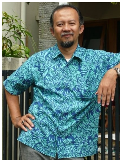
MD aus Bandung Religion: Islam Beruf: Dozent in Itenas

„Die größte Moschee in Bandung bekam auch Spende aus christliche Organisationen. In Jakarta, sind die Kathedrale und größte Moschee Istiqlal beide Nachbarn und begrüßen einander an religiösen Feiertagen durch riesige Schilder. In meinem Büro ist der religiöse Unterschied sehr nützlich, besonders beim Sicherheitspersonal. In Idulfitri wachen die Christen und in Weihnachten wachen die Moslems. Indonesien ist eigentlich ein gutes Beispiel für das Zusammenleben zwischen Religionen. Der Bombenteror und die Unruhe in Ambon und Poso passierten wegen einer kleinen Gruppe die das gute Zusammenleben provozieren möchte. Doch in Prozenten ausgedrückt sind diese Leute sehr wenig.“