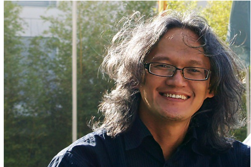
IS aus Jakarta Religion: Islam Beruf: Mediengestalter

„Ich wohne in Cilangkap, wo die meisten Einwohner, die Betawis, Muslime sind. Sie sind die ursprünglichen Bewohner der Region Jakarta. Die neuen Einwohner sind die Leute wie ich, und die Leute aus Nordsumatra/Batak, die dort in kleinen Mithäusern wohnen. Sie arbeiten als Busfahrer oder Sammeltaxi-Fahrer. Die Batak-Gemeinde ist irgendwann größer geworden und wollte eine Kirche bauen. Sie sammelten Spendengelder in einer Box in ihren Bussen und Taxis. Sie bekamen einen guten Preis von der Betawis für das Grundstück und schließlich hatten sie ihre Kirche. Die Kirche steht bis heute und niemand hat ein Problem damit, obwohl die meisten Leute, die dort wohnen, Muslime sind“