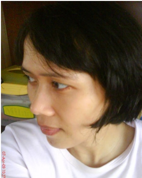
ES aus Bandung Religion: Islam Beruf: Hausfrau

„der erster Shock kam während der Studiumzeit, als einige Komilitonen behaupten, sie wären bessere Muslime und Gerüchte über das Christenisierung in Indonesien verbreiteten, die Vorurteile gegen die Christen hervorrufen würden“