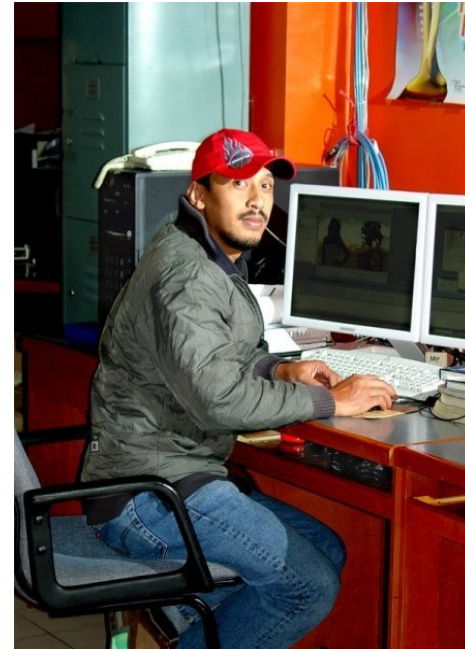
KTW aus Tangerang Religion: Islam Beruf: Animation Designer bei der Fernsehsendung 'Indosiar'

„Ich habe 6 Romane veröffentlicht. 5 davon werden von einem Verlag veröffentlicht, wo die meisten Mitarbeiter Christen sind. Trotzdem interessiert sich niemand, ob ich denselben Glauben mit ihnen habe oder nicht.“