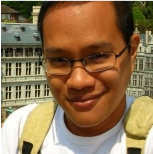
RN aus Bekasi Religion: Katholik Beruf: Industrie-Designer

„Leider berichten die Medien die Dinge, die die westliche Welt über den Islam paranoid werden lassen. Sie senden nie Berichte über die Muslime, die an Weihnachten Brot verteilen. Ich habe mehr muslimische Freunde als christliche Freunde. Meine Mittagspausen-Gang sind 7 Leute. 5 sind moslemisch und 3 davon sind ziemlich konservativ. Wir nehmen es gelassen, daß sie zum Beispiel nur essen möchten, wenn das Ort mindesten 3 Häuser weit von einem Gebäude ist, wo Schweinefleisch verkauft wird. Doch Ramadhan ist schrecklich für mich. Moment, nicht wegen der Fastenzeit, sondern weil ich natürlich nicht faste, aber trotzdem bei dem Fest nach dem Fastenbrechen bin ich immer dabei! Das ist wirklich schlecht für mein Gewicht, hehe“