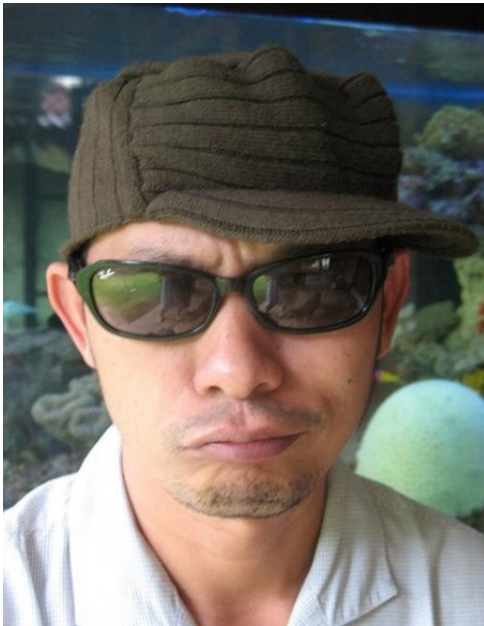
JR aus Cilangkap Religion: Islam Beruf: Exhibition Designer

„Ich wohne in Cilangkap, wo die meisten Einwohner, die Betawis, Muslime sind. Sie sind die ursprünglichen Bewohner der Region Jakarta. Die neuen Einwohner sind die Leute wie ich, und die Leute aus Nordsumatra/Batak, die dort in kleinen Mithäusern wohnen. Sie arbeiten als Busfahrer oder Sammeltaxi-Fahrer. Die Batak-Gemeinde ist irgendwann größer geworden und wollte eine Kirche bauen. Sie sammelten Spendengelder in einer Box in ihren Bussen und Taxis. Sie bekamen einen guten Preis von der Betawis für das Grundstück und schließlich hatten sie ihre Kirche. Die Kirche steht bis heute und niemand hat ein Problem damit, obwohl die meisten Leute, die dort wohnen, Muslime sind“